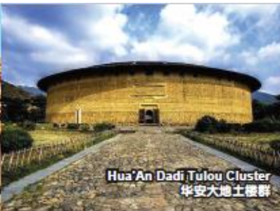
Hua'an Dadi Tulou Cluster 华安大地土楼群