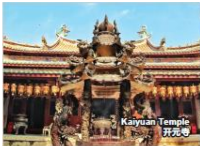
Kaiyuan Temple 开元寺